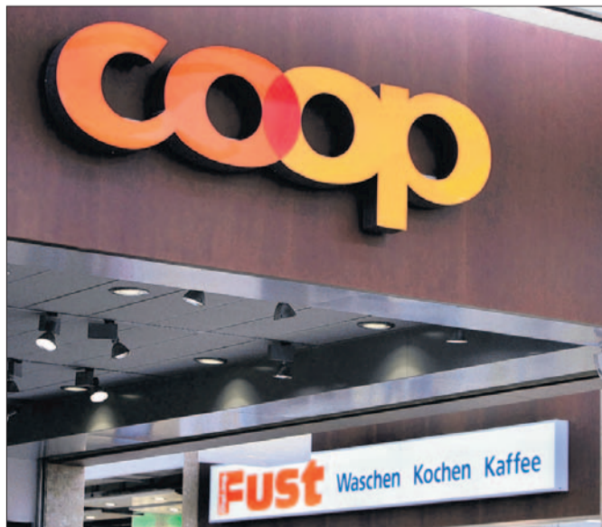
Coop darf Fust übernehmen: Die Wettbewerbskommission hat trotz vertiefter Prüfung keine Einwände gegen den Deal. (key)

Da Coop im Bereich Kleinhaushaltgeräte zusammen mit der Migros eine marktbeherrschende Stellung einnehmen könnte, macht die Weko in diesem Bereich Auflagen. Coop muss auf Exklusivitätsabsprachen mit den Lieferanten verzichten, und Fust muss bei den Kleinhaushaltgeräten während fünf Jahren eine eigenständige Sortiments-, Preis- und Aktionspolitik betreiben. (zl) Seite 21