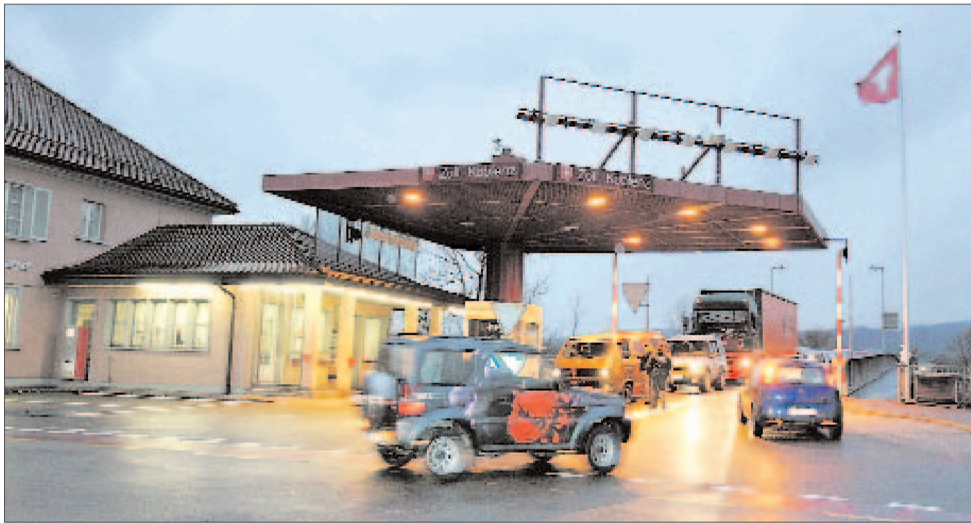
In den Köpfen der Unternehmer beidseits des Rheins existiert der Zoll, hier bei Koblenz, längst nicht mehr. (Sibylle Meier)

Die positive Wahrnehmung des potenten Wirtschaftsraumes ist in beiden Ländern durchaus vorhanden, wie das gestern Abend in Waldshut anberaumte Podium verdeutlichte, das auf