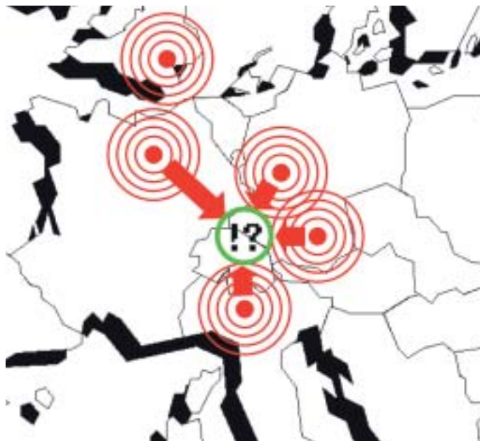
Südbaden und der Grossraum Zürich können sich im globalen Wettbewerb der Standorte nur behaupten, wenn sie ihr gemeinsames Potenzial grenzübergreifend ausschöpfen.

Sensibilität für den grenzübergreifenden Wirtschaftsraum Süddeutschland-Zürich stärken. Handlungsbedarf ist in verschiedenen Bereichen zu orten: beim Verkehr,